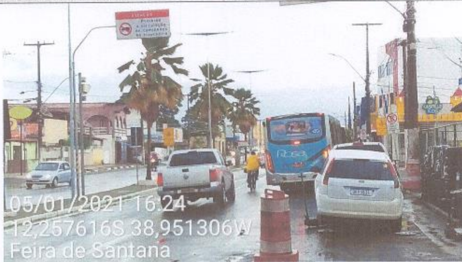
Vista do local.