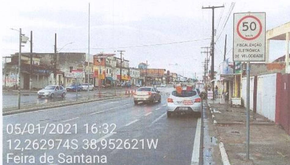
Vista do local.