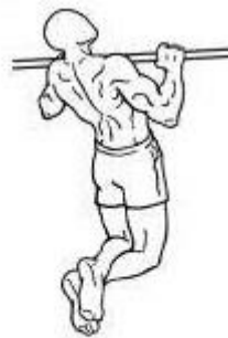
Figura 3 – Posição 02 intermediária.