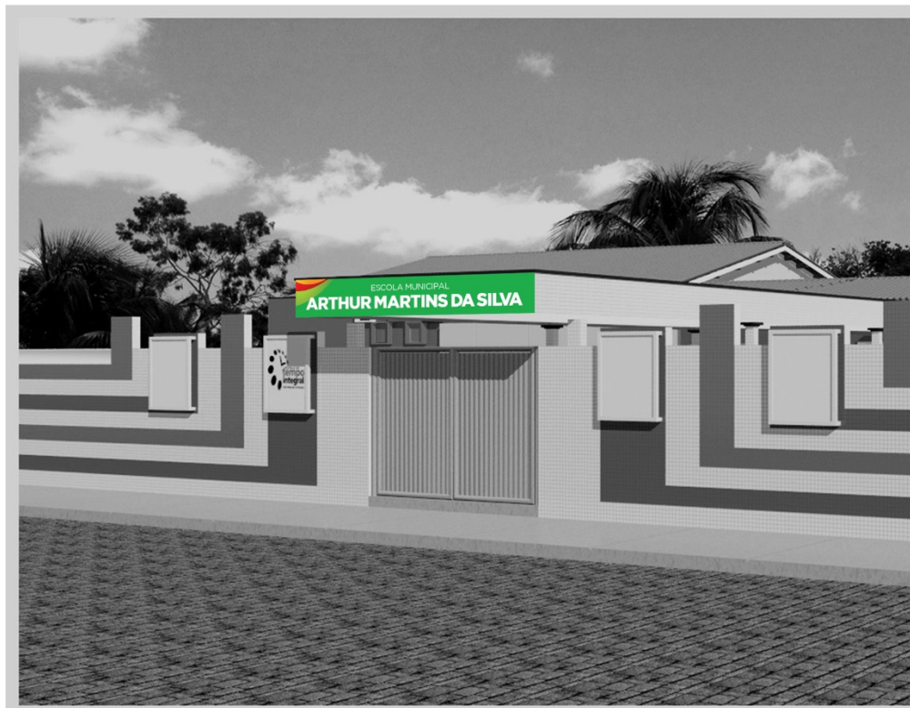
IMAGEM C: PLACA CEGA FACHADA ESCOLAS

CENTRO MUNICIPAL DE EDUCAÇÃO INFANTIL PROFESSORA ELI QUEIROZ DE OLIVEIRA