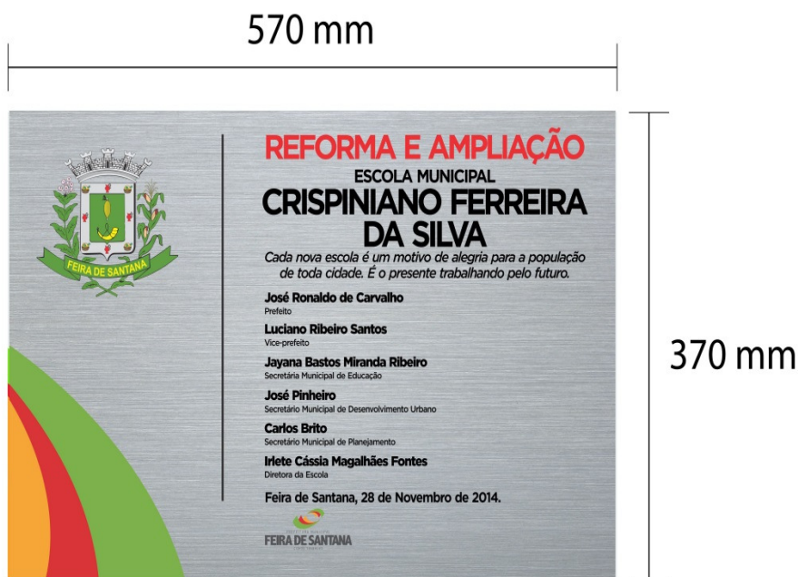
IMAGEM B: PLACA DE INAUGURAÇÃO

Obs.: O texto que irá compor cada placa será informado a cada pedido.